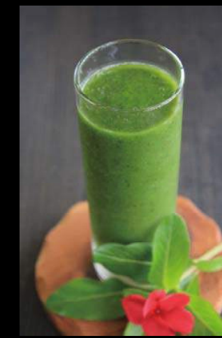
小松菜美肌スムージー 500円