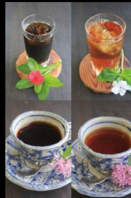
珈琲 / 紅茶(アイス・ホット) 各 300円