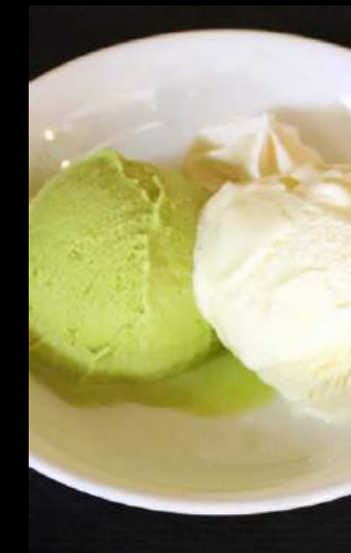
アイスクリーム 150円