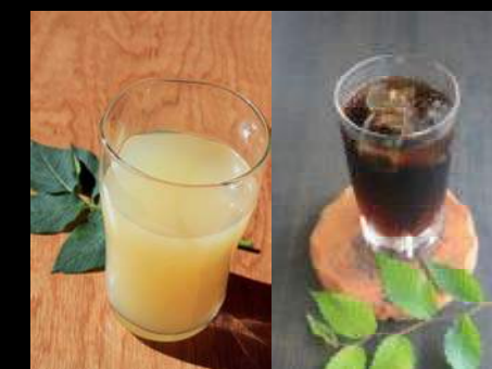
本物の - みかんジュース - - りんごジュース -