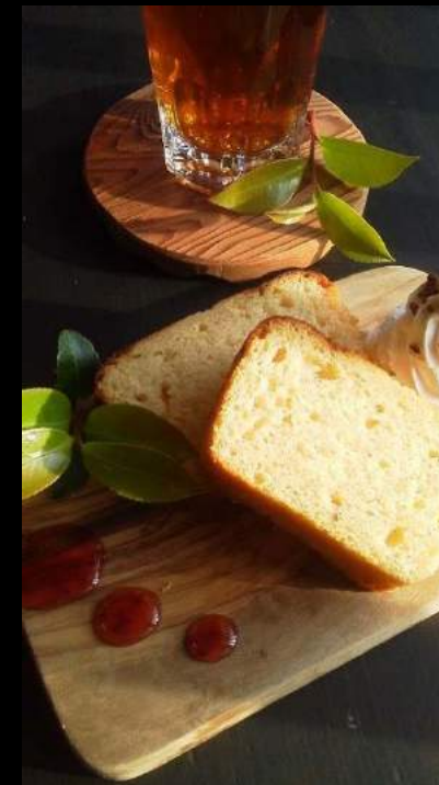
パウンドケーキセット 800円