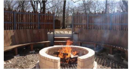
ファイヤーサークル焚き火