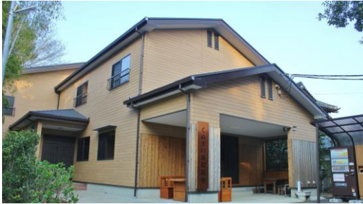
くぬぎの森環境塾外観

くぬぎの森環境塾1Fの教室は、会議、セミナー、研修等大人数が一同に会して集まることが可能です。団体の勉強会や保育園のお別れ会、習い事の教室など、幅広くご利用いただいています。