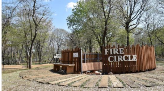
ファイヤーサークル外観

くぬぎの森「香のヤマ」にある、里山の中で焚き火を囲めるアウトドア施設。 揺れる炎を見つめながら、少人数のパーティー、おしゃべり会、研修の対話会などご利用が可能です。