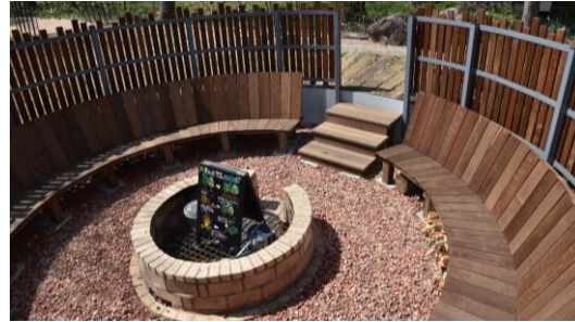
ファイヤーサークル内側