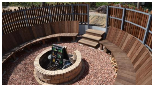
ファイヤーサークル内側