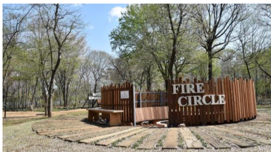
ファイヤーサークル外観

くぬぎの森「香のヤマ」にある、里山の中で焚き火を囲めるアウトドア施設。 揺れる炎を見つめながら、少人数のパーティー、おしゃべり会、研修の対話会などご利用が可能です。