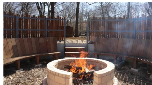
ファイヤーサークル焚き火