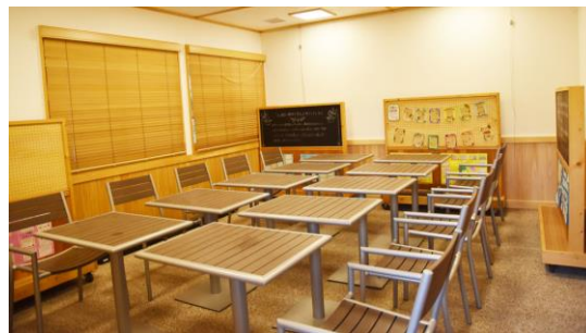
ミーティングルーム